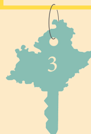
TABLE RONDE 3 : Les énergies renouvelables intégrées à leur environnement

Comment faire cohabiter énergies renouvelables et biodiversité, agriculture, architecture et paysage ?