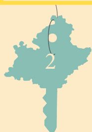
TABLE RONDE 2 : Les énergies renouvelables au service du développement économique

Quelle structuration des filières, quelle relation entre innovation, recherche et industrialisation? Quelle place pour les TPE et les PME?